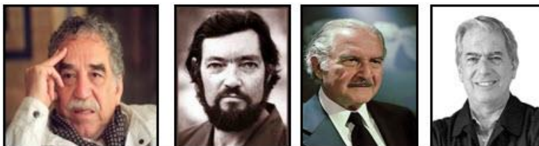
PILARES DEL 'BOOM LATINOAMERICANO': A inicios de los 60', García Márquez, Julio Cortázar, Carlos Fuentes y Mario Vargas Llosa, revolucionaron la Literatura en América Latina.